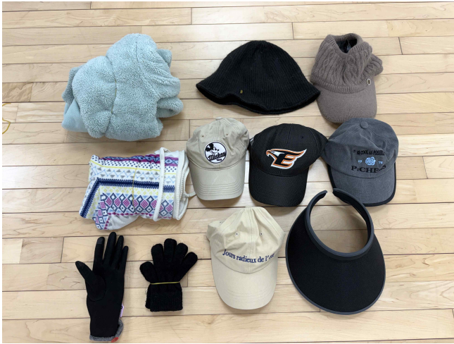
의류 / 모자 / 장갑