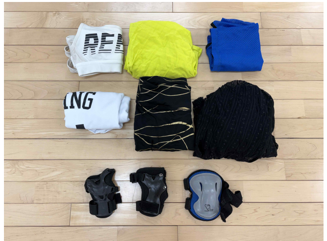
운동복 및 보호대