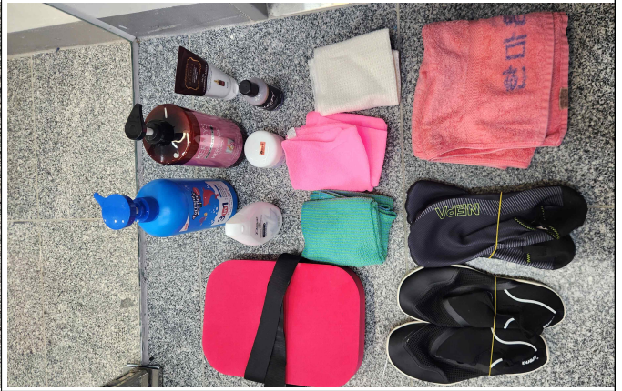
물품 사진 2 (샤워용품 및 수영물품 등) 2025. 6. ~ 2025. 12.