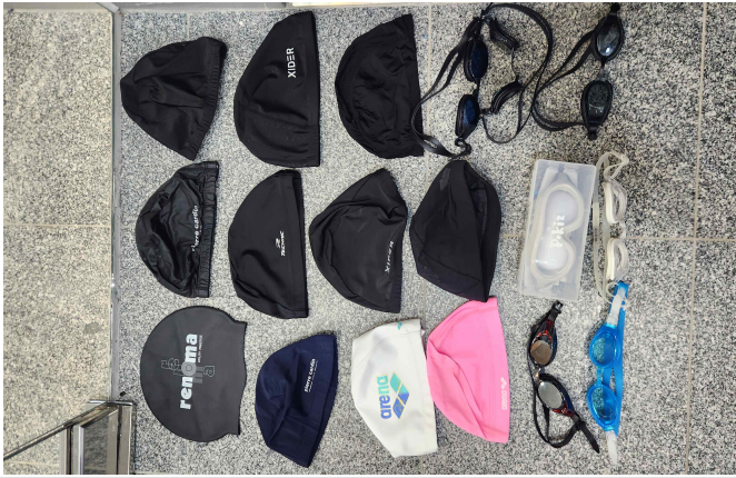
물품 사진 1(수모, 수경) 2025. 6. ~ 2025. 7.