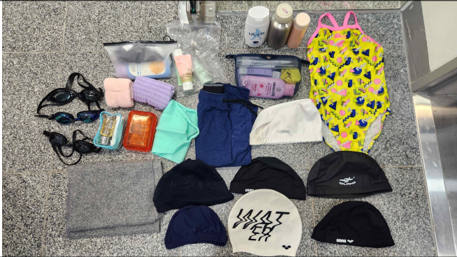
물품 사진 7(수모, 수경 등) 2025. 10.