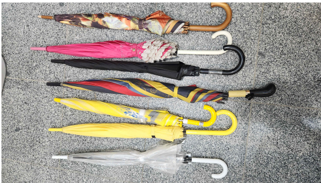
물품 사진 3(우산) 2025. 6.~2025. 12.